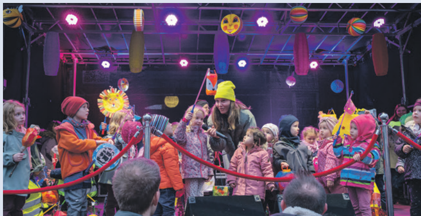
Die Kinder präsentierten stolz ihre Laternen auf der Bühne.