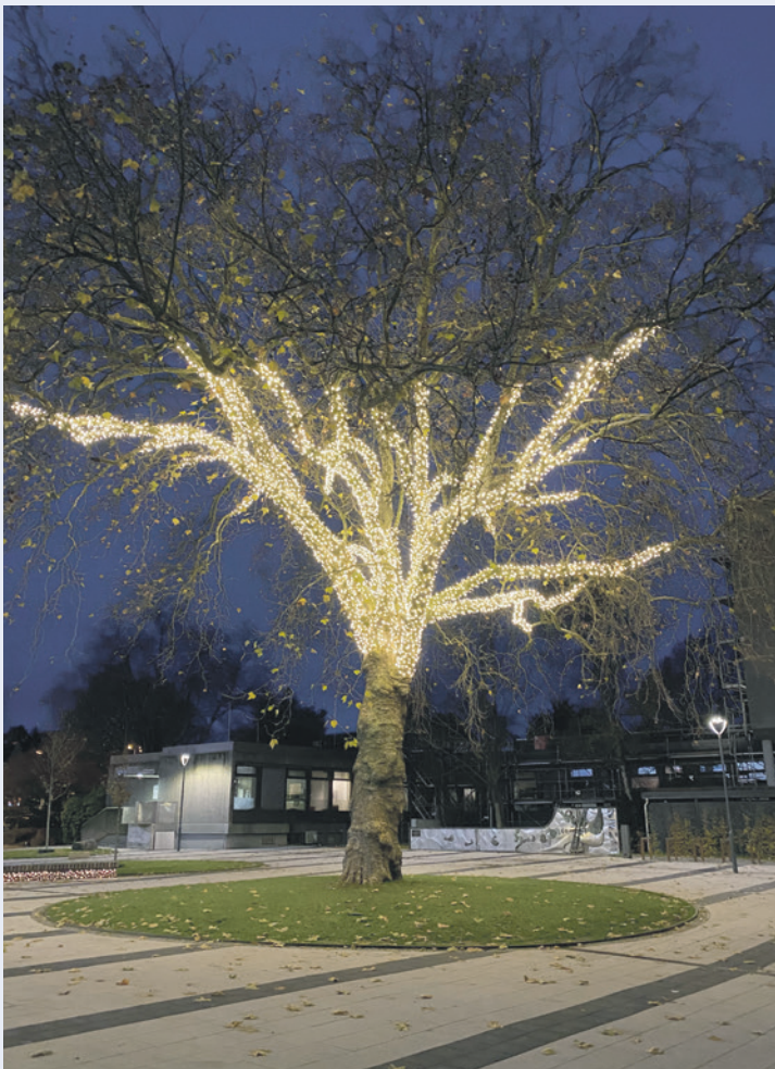
Die Weihnachtsbeleuchtung ist nur durch die vielen Sponsoren möglich. ProCity

Optik Dohms Orthopaedicum Gevelsberg Provinzial Merken & Vogt Rathskeller Gevelsberg Rats-Apotheke Rechtsanwälte Schönlau/Edelmann Rechtsanwälte und Notare