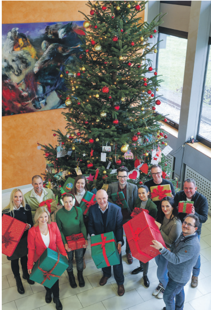
Die AVU-Mitarbeitende erfüllen seit 16 Jahren Wünsche von Kindern und Jugendlichen in sozialen Einrichtungen. AVU

„Der Wunschbaum steht für Nächstenliebe und zeigt, wie viel erreicht werden kann, wenn viele mit anpacken“, betonen die drei Organisatorinnen. „Gerade in der Weihnachtszeit erinnert er uns daran, dass niemand vergessen werden sollte.“