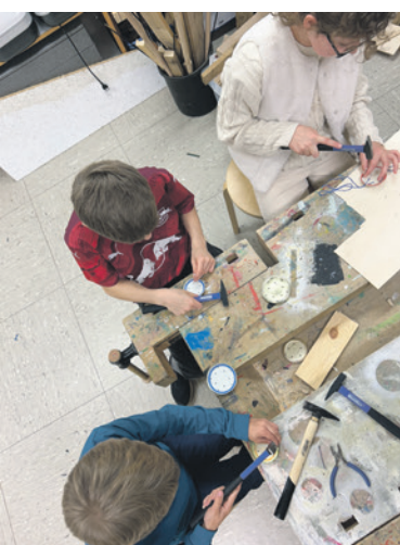
Fleißig wurde in 13 Kitas und einer Schule gewerkelt, um die Tannenbäume zu schmücken.

zu bewundern und laden beim Bummeln und Einkaufen dazu ein, sich von der weihnachtlichen Stimmung anstecken zu lassen. Ein großer Dank geht an die vielen kreativen kleinen Helfer, die Gevelsberg mit ihrem Einsatz noch ein Stück schöner gemacht haben. Außerdem steht ein großer Weihnachtsbaum auf dem Vendômer Platz, der aus dem Gevelsberger Stadtgarten kommt. Dieser ist mit einer großen Lichterkette geschmückt.