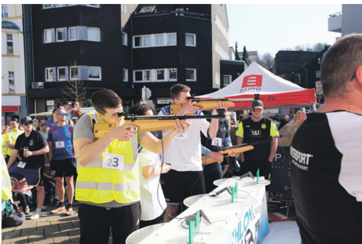
Geschossen wird nächstes Jahr im Stehen und im Liegen – aus zehn Meter Entfernung.

Weitere Informationen gibt es unter www.Biathlon-Tour.de .