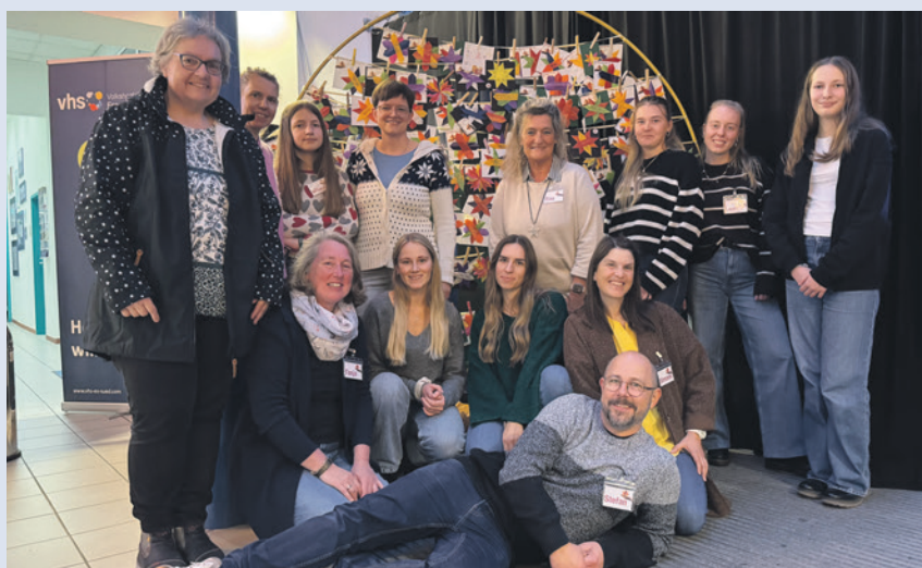
Das „Sternebaschteln“ für den guten Zweck erhielt einen großen Zulauf.