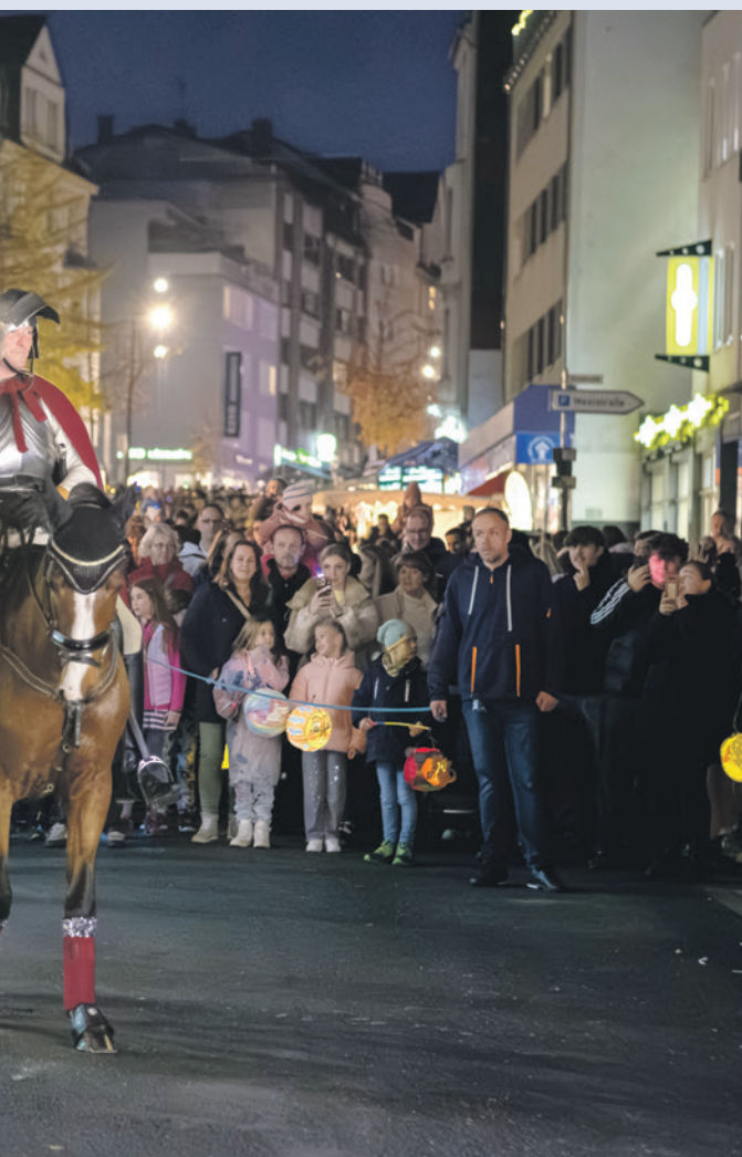
Die Martinslegende gelesen und anschließend symbolisch der

Und morgen geht es dann schon weiter: Mit dem Mondscheinbummel. Der Startschuss für die Vorweihnachtszeit in Gevelsberg.