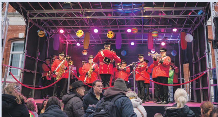
Musik gab es von den Iserlohner Waldstädtern.