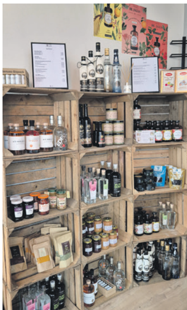
Weine, Feinkost und Spirituosen gehören zum Sortiment.