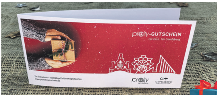
Der ProCity-Gutschein ist zu jeder Jahreszeit eine schöne Geschenkidee.