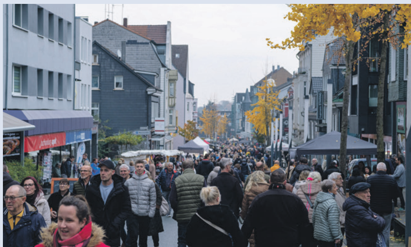
Die Innenstadt war während des verkaufsoffenen Sonntags gut besucht.