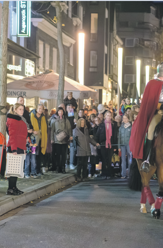
St. Martin hoch zu Roß: Nach dem Laternenumzug wurde die Mantel geteilt.

Laternen wurde diesmal von Mag Slota auf besonders kreative Weise begleitet und sorgte für viele staunende Gesichter. Für die musikalische Untermalung sorgten die Iserlohner Waldstädter, deren Musik den Markt eine stimmungsvolle Atmosphäre verlieh. Geschäftsleute waren zufrieden Rund um die Innenstadt zeigten sich zahlreiche Ausstellerinnen und Aussteller sowie lokale Einzelhändler sehr zufrieden mit dem verkaufsoffenen Sonntag. Es wurde fleißig gebastelt – vor allem das „Ster-