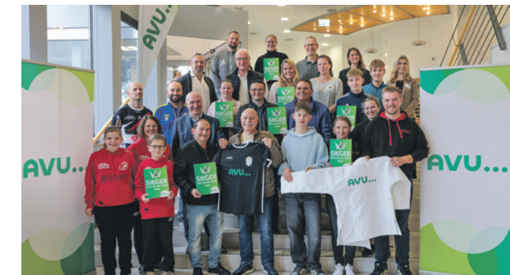
Freuen sich über die Gewinne: die Vereine aus dem Ennepe-Ruhr-Kreis.

Also: Dranbleiben, Daumen drücken – und gespannt bleiben, welche Schul-Teams sich über die nächsten Kronen freuen dürfen.